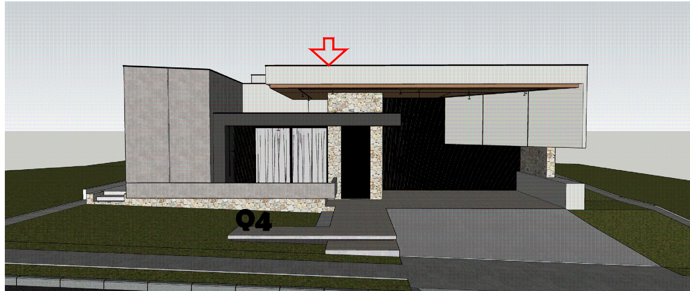
01 MOSTRA A VISTA TETIVA DA COBERTURA DA GARAGEM E APARECER GERAL NA GARAGEM