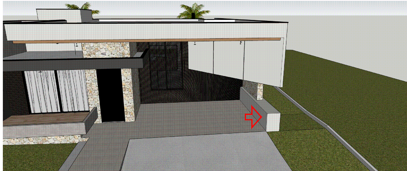
03 MOSTRA O VOLUME DECORATIVO NA LATERAL DA GARAGEM