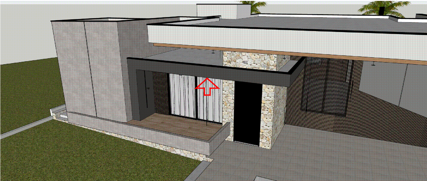
02 MOSTRA A COBERTURA DA PORTA EM BALANÇO SOBRE A COBERTURA DA GARAGEM